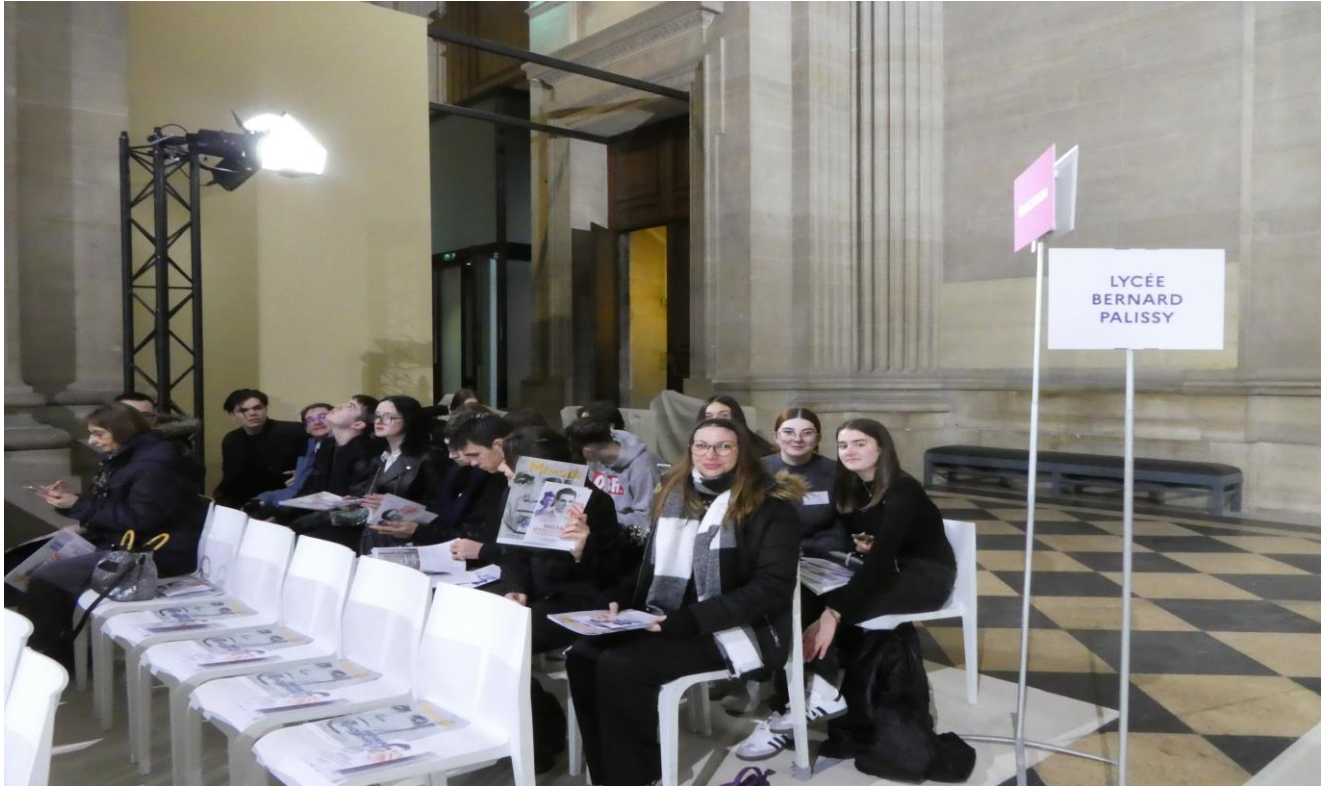
Installation du groupe dans le Panthéon