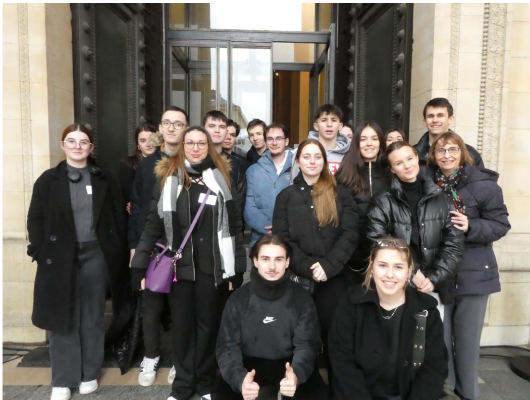
Les élèves du Lycée PALISSY juste avant d'entrer dans le Panthéon.