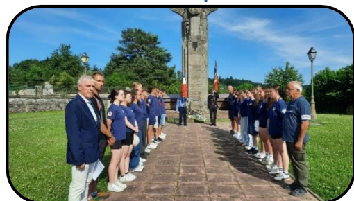
@ Collège Eugène François

Ces différents temps ont été entrecoupés de moments de détente et de sport, très utiles pour renforcer la cohésion de classe. Canoë sur le lac de Pierre Percée, randonnée, accrobranche, tyrolienne se sont succédés durant les deux jours. La classe a fait l'expérience de passer la nuit sous tente, en « lits Picot » prêtés et installés au stade de Badonviller par le 53 e Régiment de Transmissions de Lunéville, l'unité marraine de la classe.