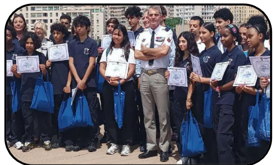
Collège Stéphane Mallarmé

Les élèves du collège Stéphane Mallarmé ont abordé ce thème en produisant un jeu de l'oie. Les collégiens de Grande Bastide ont traité le sujet sous l'angle des risques d'incendie dans les calanques.