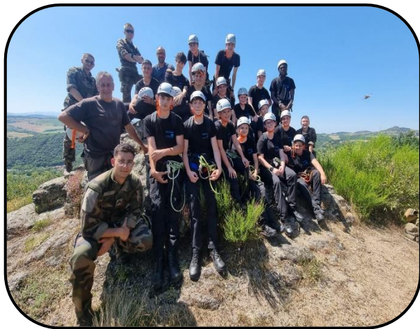
@ Lycée Gergovie

Entre les cours d'histoire des armées, de topographie et de physiologie, les élèves ont pu enrichir leurs connaissances tout en réfléchissant sur des enjeux contemporains de la défense et des armées.