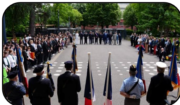
@ Lycée Claude Bernard

Les élèves de seconde de la classe défense ont rédigé des discours lus au moment de la cérémonie. La chorale du lycée a interprété le Chant des partisans , et les élèves de l'option arts plastiques ont réalisé des fresques en hommages aux résistants caladois. Les Ecoles Militaires de Santé de Lyon-Bron (EMSLB) ont également été conviées à assister à la cérémonie.