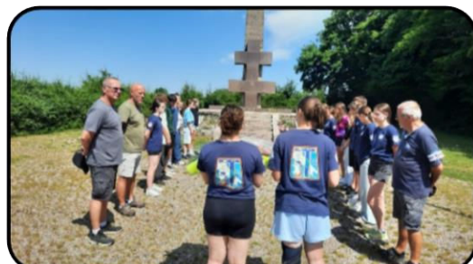
@ Collège Eugène François