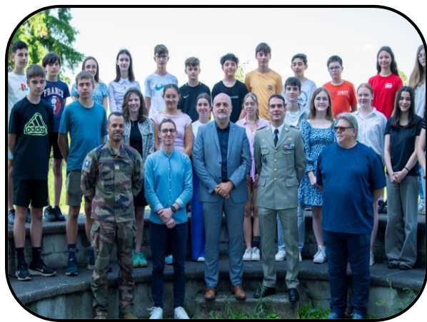
📍 Collège Louis Pasteur

Les élèves s'engagent en faveur des militaires blessés dans le cadre d'une collecte pour la fondation du Bleuet de France. La mairie de Faulquemont leur a confié le drapeau d'une association d'anciens combattants qu'ils ont l'honneur de porter lors des cérémonies commémoratives.