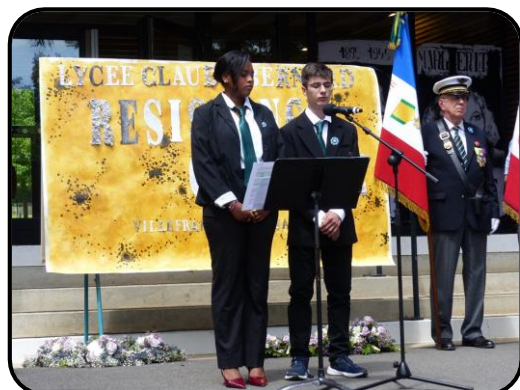
@ Lycée Claude Bernard