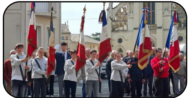
Collège Saint-Jean de Vihiers

Ce moment de commémoration leur a permis de mieux comprendre l'histoire nationale et de s'impliquer activement dans la vie citoyenne.