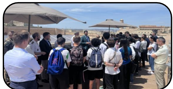
Collège Grande Bastide