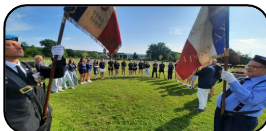
@ Collège Eugène François