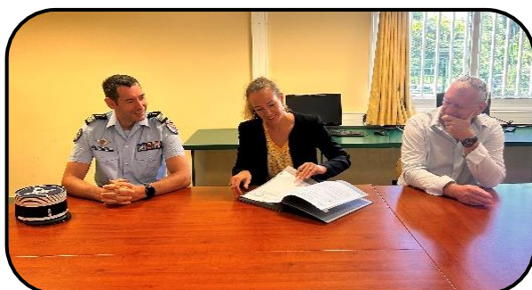
@ Collège Jean Fayard - Katiramona

L'engagement du collège se renforce par la signature d'une nouvelle convention avec la Gendarmerie Nationale, unité marraine de la classe défense.