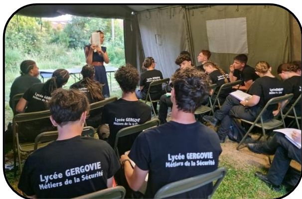
@ Lycée Gergovie