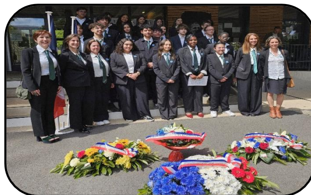
@ Lycée Claude Bernard