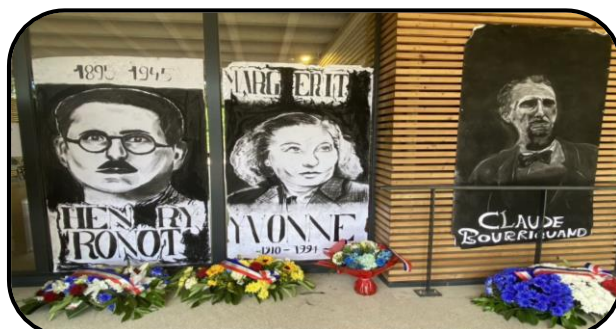
@ Lycée Claude Bernard