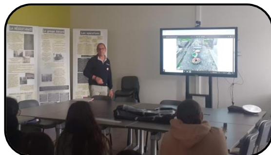
📍 Lycée Dumaine

Enfin, les élèves ont pu profiter de l'exposition temporaire présentant les maquis de Cluny et d'Azé durant la Seconde Guerre mondiale