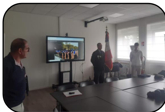
📍 Lycée Dumaine