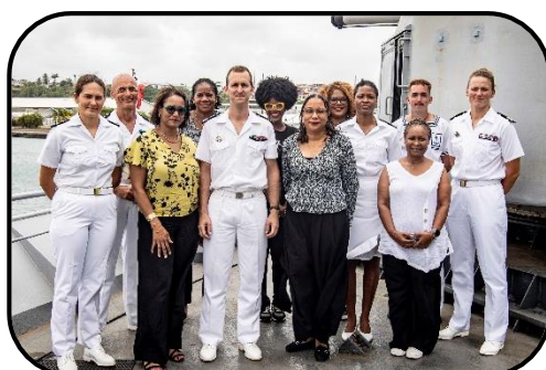
@ Collège Jean Fayard - Katiramona

La cérémonie s'est tenue à bord du Ventôse, et s'est poursuivie par la visite de la frégate. Cette signature marque la création de la première classe défense « à enjeux maritimes » des Antilles.